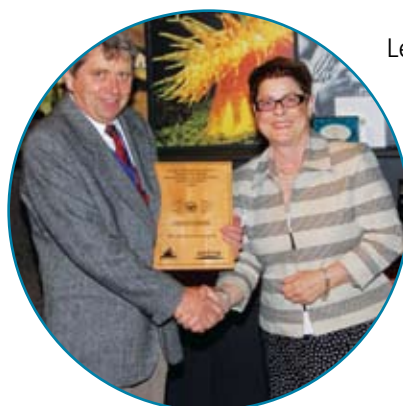
Le gagnant dans la catégorie « Innovation en géomatique » était W.D. McIntosh Land Surveying Ltd. pour le projet « Support pour la réaction d'urgence à l'inondation de Vanderhoof en 2007 ». Les finalistes étaient Bennett Land Surveying Ltd. et la Direction des titres de propriétés et de l'arpentage de la Colombie-Britannique.